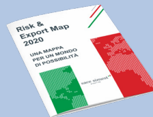
Risk & Export Map