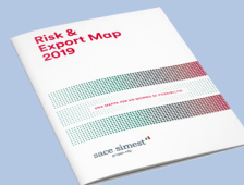
Risk & Export Map